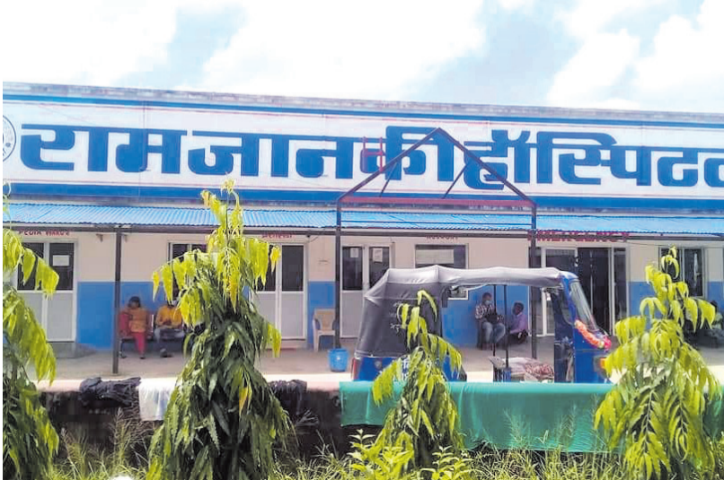
अभियुक्तलाई हिरासत छल्न प्रयोग गरिएको रामजानकी हस्पिटल।