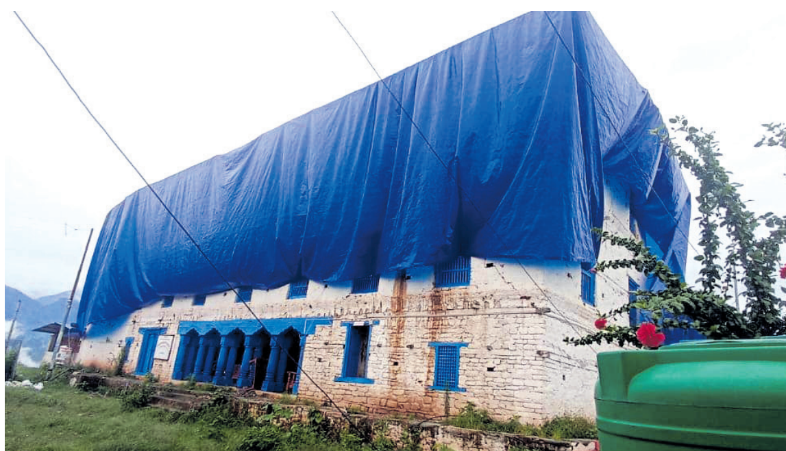
वर्षाबाट जोगाउन त्रिपालले ढाकिएको जाजरकोट दरबार।

डिभिजन वन कार्यालयको सहयोग र समन्वयमा अत्यन्त जोखिमका बावजूद पनि मनसुनजन्य प्रकोप तथा वर्षाबाट थप क्षति हुन नदिन त्रिपालले ढाक्ने काम गरिएको प्रजिअ अधिकारीको भनाइ छ।