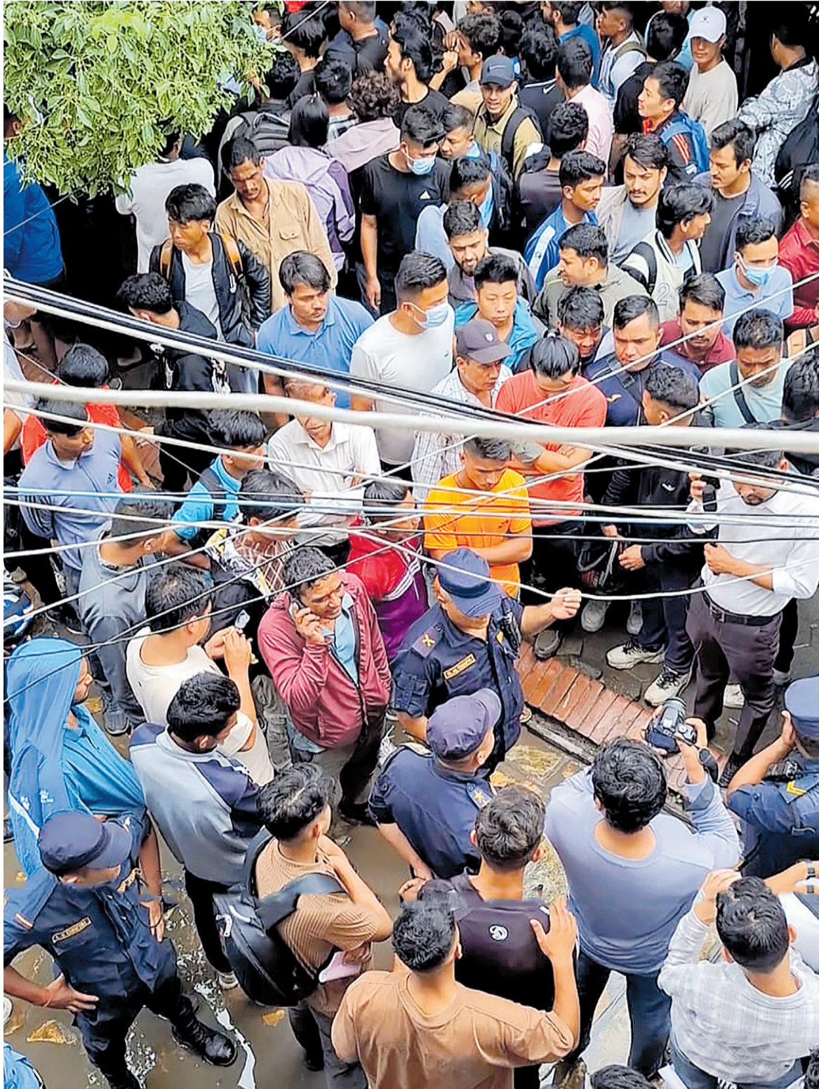
सर्भर विग्रिएर सेवा अवरुद्ध हुँदा समस्यामा परेका सर्वसाधारण सोमबार दिउँसो यातायात कार्यालय ठूलोभयाङबाटै हो-हल्ला गर्दै।