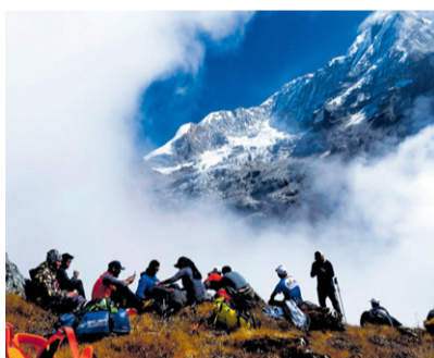
वागमती वृत्तान्त - पृष्ठ ३