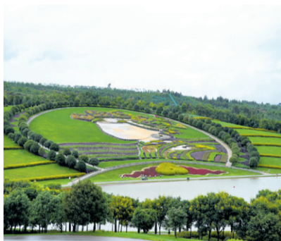
इतिहास पल्टाउँदै फड्को माई - पृष्ठ ४