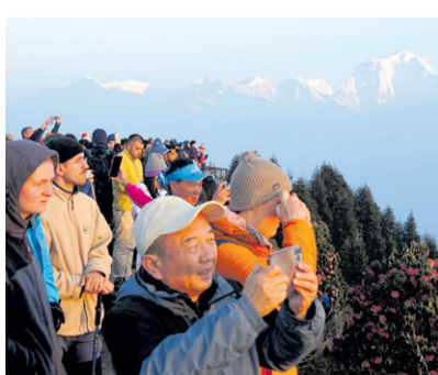
म्याग्दीमा आए ३१ हजार पर्यटक - पृष्ठ ७