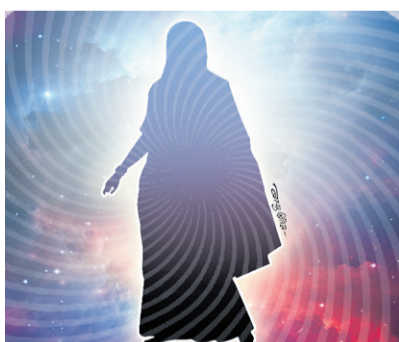
तार्कालीको तन्त्र - पृष्ठ ५