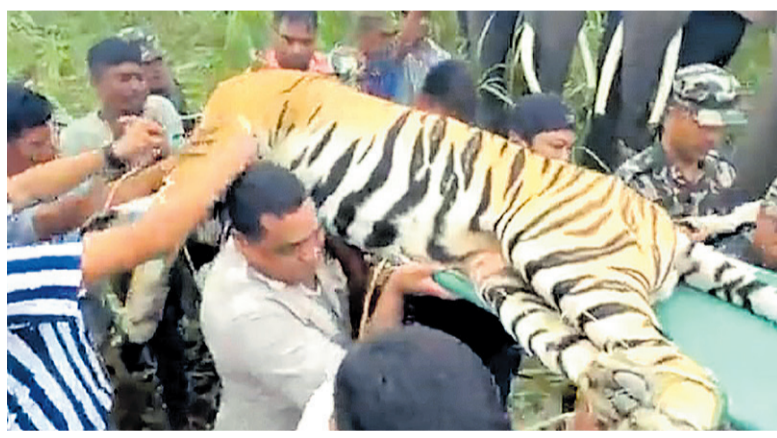
कञ्चनपुरको दोधारा चादनी २ स्थित उखुबारीबाट बाघलाई डार्ट गरेर नियन्त्रणमा लिई निकुञ्ज टोली।