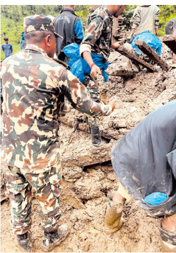
गुल्मीमा पनि ४ को मृत्यु

बागलुङको बडिगाड गाउँपालिकाको अवस्था गम्भीर रहेको र अन्यको अवस्था मध्यम रहेको छ। घाइतेहरूको उद्धारका लागि काठमाडौंबाट नेपाली सेनाको हेलिकप्टर