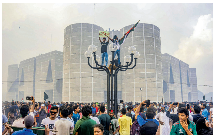
बंगलादेशको संसद् भवनबाहिर विजयउत्सव मनाउँदै प्रदर्शनकारीहरू।

वर्षका हुन्। गिरिबन्धुको रेखामुनि रहेकाहरूलाई लक्षित गरेर उनले गाउँ-गाउँमा ग्रामीण बैंक तथा लघुवित्त स्थापना गरेका थिए। त्यसका लागि उनलाई सन् २००६ को नोबेल शान्ति पुरस्कार दिइएको थियो। युनुस बंगलादेश छोडेको प्रधानमन्त्री शेख हसिनाका प्रतिद्वन्द्वी हुन्। गएको जनवरीमा बंगलादेशको एउटा अदालतले युनुसलाई देशको श्रम कानून उल्लंघन गरेको भन्दै जेल सजाय सुनाएको थियो। तर, उनले यो आरोप राजनीति प्रेरित भएको भन्दै आलोचना गरेका थिए।