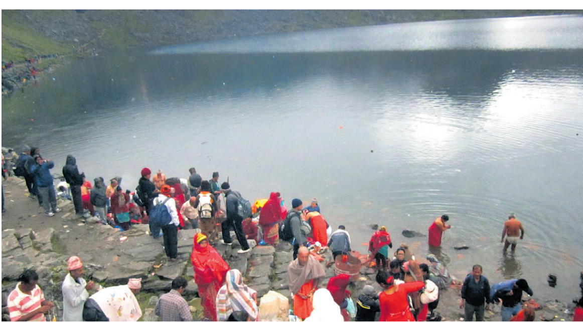
पवित्र तीर्थस्थल गोसाइँकुण्डमा स्नान गर्दै यात्री।