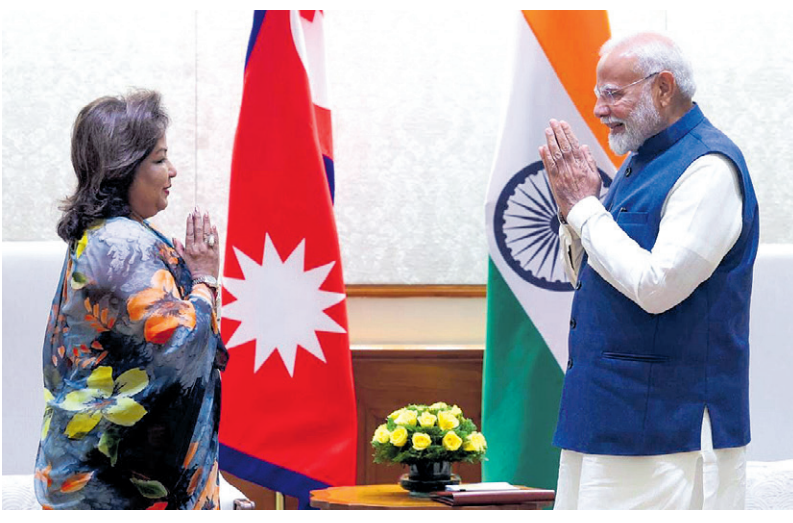
भारत भ्रमणमा रहेको परराष्ट्रमन्त्री डा. आरजु राणा देउवा सोमबार साँझ नयाँ दिल्लीमा भारतीय प्रधानमन्त्री नरेन्द्र मोदीसँग भेटवार्ताका क्रममा।

भारतीय प्रधानमन्त्री मोदीले परराष्ट्रमन्त्री देउवालाई स्वागत गर्न पाउँदा आफूलाई खुसी लागेको सामाजिक सञ्जाल एक्समा लेखेका छन्। मोदीले भारत र नेपालबीच घनिष्ठ सभ्यताको सम्बन्ध र प्रगतिशील तथा बहुआयामिक साझेदारी रहेको पनि बताएका छन्। उनले दुई मुलुकको विकास साझेदारीमा निरन्तर गतिका लागि तत्पर रहेको उल्लेख गरेका छन्।