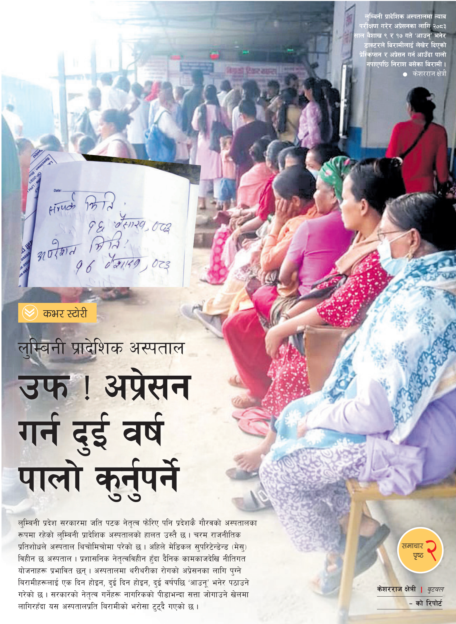
लुम्बिनी प्रादेशिक अस्पतालमा ल्याब परीक्षण गरेर अप्रेसनका लागि २०८३ साल वैशाख ९ र १७ गते 'आउनु' भनेर डाक्टरले बिरामीलाई लेबेर दिएको प्रेक्चरले अप्रेसन गर्न आउनु पालो नपाएपछि निराशा बसेका बिरामी। • केशरराज क्षेत्री

(सहप्राध्यापक अर्याल, विधुवन विश्वविद्यालयको पत्रकारिता र आमसञ्चार केन्द्रीय विभागका प्रमुख हुन्।)