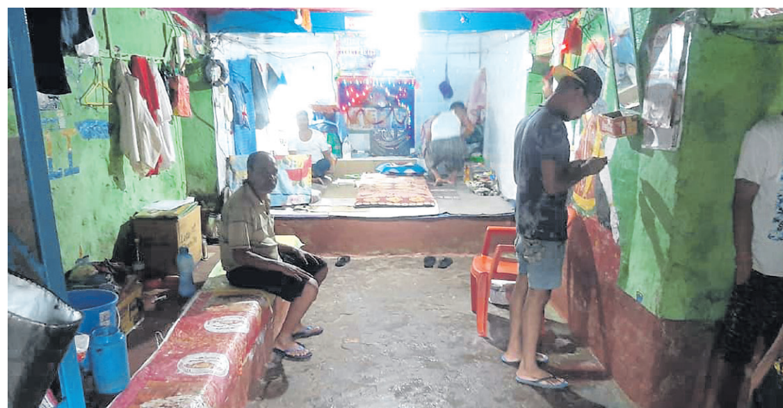
पसां कारागारमा रहेका कैदीबन्दीहरू। ● पसां कारागारको फेसबुक पेजबाट