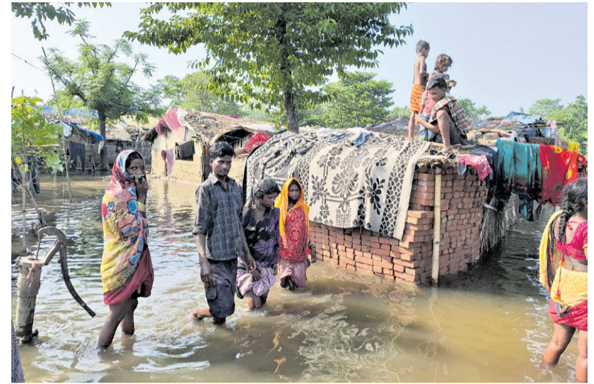
डुबानमा परेको सल्लाहीको बलरा नगरपालिका-३ को मुसहर बस्ती। • सुनिल ठाकुर