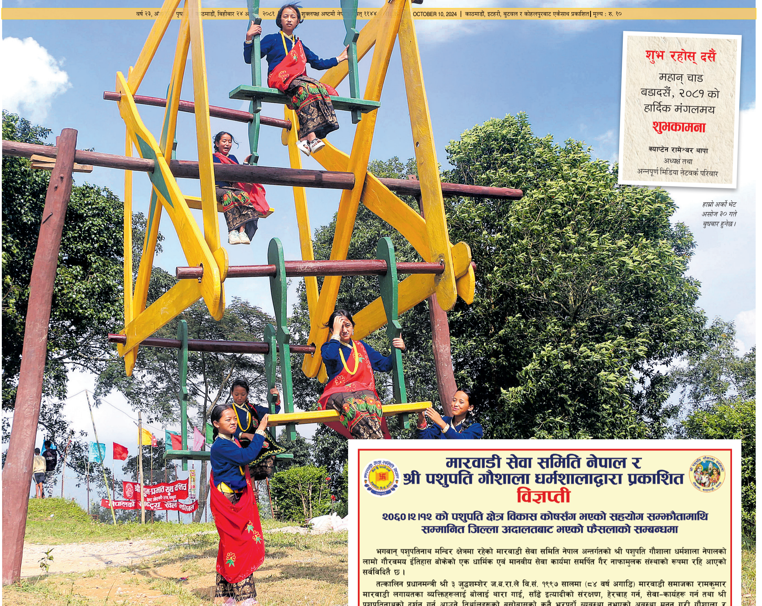
धनकुटाको छथरजोरपाटी गाउँपालिका-३, पिडडौंझामा राखिएको रोटोपिडमा रमाउँदै युवतीहरू।

हाम्रो अर्को भेट असोज ३० गते बुधबार हुनेछ।