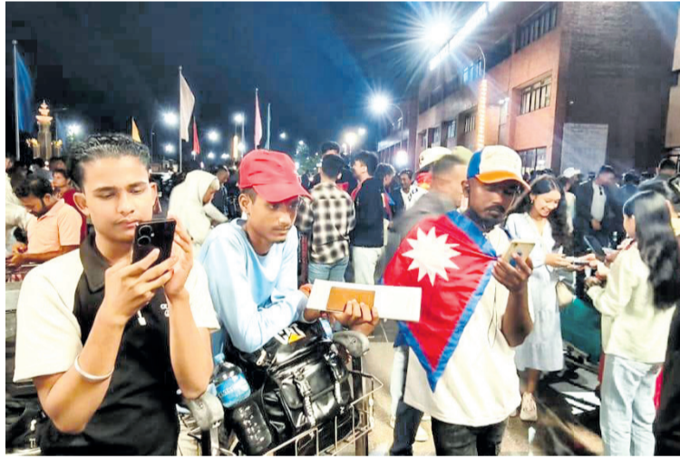
वैदेशिक रोजगारीका लागि परदेश हिँडेका युवाहरू त्रिभुवन अन्तर्राष्ट्रिय विमानस्थलमा प्रस्थानका लागि समय कुट्न। राजकरण महतो