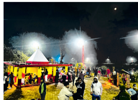
जहाँ मध्यरातमा चिच्याएर 'वर' मागिन्छ !