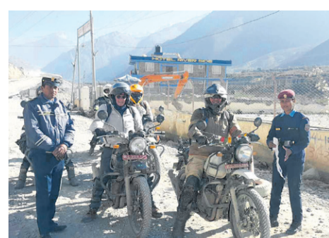
सवारीसाधन कारबाहीबाट साढे ७ लाख राजस्व