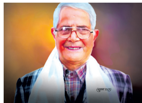
बालयात्रा विट मारेका गान्धीपथका गोपाल