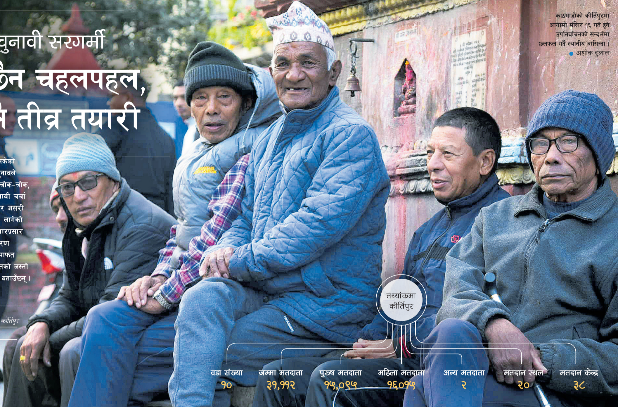
काठमाडौंको कीर्तिपुरमा आगामी मंसिर १६ गते हुने उपनिर्वाचनको सन्ध्यामा छलफल गर्दै स्थानीय बासिन्दा। ● अशोक दुलाल