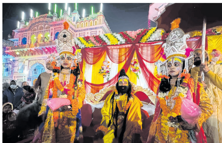
जनकपुरमा विवाहपञ्चमी महोत्सवको रौनक।

त्रेता युगमा मिथिलाको राजकुमारी सीता र अयोध्याका राजकुमार रामबीच जुरेको वैवाहिक सम्बन्धलाई जनकपुरवासीले प्रत्येक वर्ष वैवाहिक वार्षिकोत्सवको रूपमा मनाउँदै आएका छन्। मिथिलामा छोरीको विवाहको बेला गरिने सम्पूर्ण विधि र प्रक्रियाहरू यस महोत्सवमा गरिन्छ। सप्ताहव्यापी विवाह महोत्सवको मुख्य आकर्षण विवाहपञ्चमी अर्थात् बिहे हुनेदिन हुन्छ। यस वर्ष मंसिर २१ गते शुक्रबार रामसीताका विवाह गरेर विवाहपञ्चमी मनाइँदै छ।