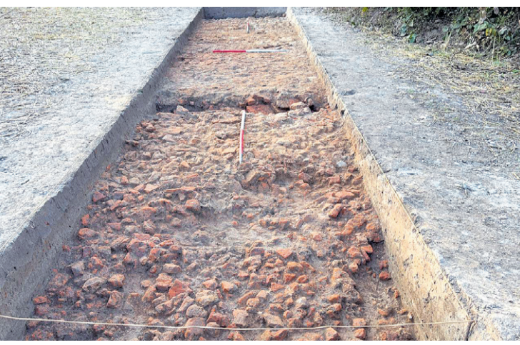
पण्डितपुरमा फेला परेका प्राचीन संरचना। • हरि शर्मा

पुरातत्व विभागले गौतम बुद्धको मावली (पण्डितपुर क्षेत्र) मा ४ दिनदेखि उत्खनन गरिरहेको छ। नवलपरासीको रामग्राम-१८ स्थित पण्डितपुर क्षेत्रमा गरिएको उत्खननबाट प्राचीन संरचनाहरू फेला पर्न थालेका छन्। यसअघि गरिएका भू-भौतिक सर्वेक्षण (जियोफिजिक्स) र उत्खननबाट फेला परेका पुरातात्विक संरचनाका आधारमा उत्खनन सुरु गरिएको हो। पण्डितपुर गौतमबुद्धको मावली क्षेत्र (कोलीय गणराज्यको क्षेत्र) रहेको भन्दै विभिन्न समयमा सर्वेक्षण र उत्खनन गरिएका थिए।