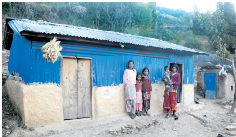
नलगाड-७ दल्लिमा बाढी बस्तीमा रहेको अस्थायी आवास।

बिहीबार बिहान ६ बजेर ३६ मिनेटमा जाजरकोटमा भूकम्प गयो। टहरामा दिन