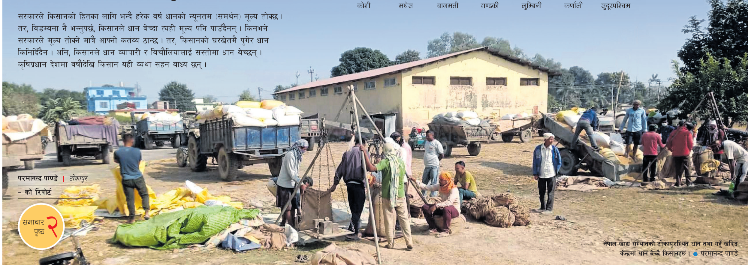
नेपाल खाद्य संस्थानको टीकापुरस्थित धान तथा गहुँ खरिद केन्द्रमा धान बेच्दै किसानहरू। • परमानन्द पाण्डे