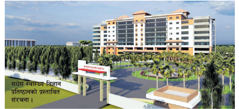
मधेस स्वास्थ्य विज्ञान प्रतिष्ठानको प्रस्तावित संरचना।