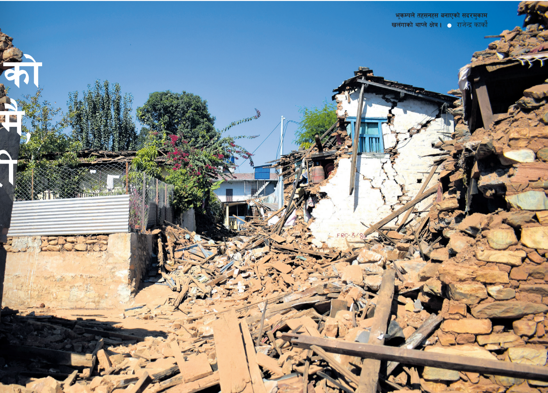
भूकम्पले तहसनहस बनाएको सबरमुकाम खलंगाको थाने क्षेत्र | राजेन्द्र कार्की

मुलुकमा दैनिकजसो साना-ठूला भूकम्पका धक्का गइरहेका छन्। कति बेला के हुने हो भन्ने त्रासमा जनता छन्। तर, सरकारको पूर्वतयारी भने फिटिक्कै देखिँदैन। ‘आगो लागे क्वा खन्न जाने’ प्रवृत्तिले भूकम्प लगायतका प्राकृतिक विपत्तिमा देशले ठूलो धनजनको क्षति बेहोरिरहेको छ। भूकम्पविद्हरू पश्चिम नेपाल ‘महाभूकम्प’ को जोखिममा रहेको बताइरहेका छन्। त्यसैकारण सरकारले अब किन्तु परन्तु नभनी पूर्वतयारी र सुरक्षाका कार्यक्रम तत्काल अघि बढाउनुपर्ने जरुरी छ।