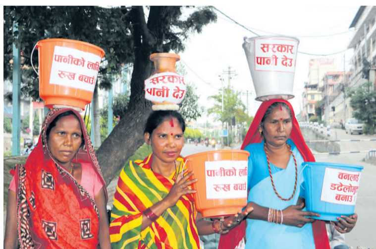
चुरे संरक्षणका लागि वैशाखमा पैदल यात्रा गरेर काठमाडौं आएका मधेशवासीहरू।