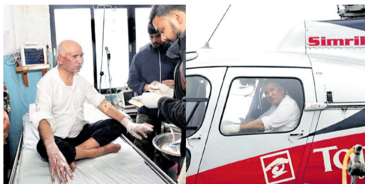
कीर्तिपुर अस्पतालमा उपचारका क्रममा उपप्रधान तथा अर्थमन्त्री पौडेल। त्यसअघि सिम्कि हेलिकप्टरमार्फत पोखराबाट काठमाडौं आउने क्रममा।