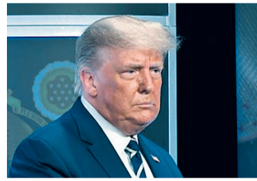
सुरज भण्डारी | अमेरिका

यूक्रेनसँगको सम्बन्ध चिसिएको अवस्थाबीच अमेरिकी राष्ट्रपति डोनाल्ड जे ट्रम्पले हमासलाई अन्तिम चेतावनी दिएका छन्। उनले बन्धक गराइएकाहरूलाई बिना शर्त रिहा गर्न हमासलाई चेतावनी दिएका हुन्। गाजालाई स्वतन्त्र बनाउने लडाईं अन्तिम चरणमा पुगेको बताउँदै यसका लागि इजरायललाई आवश्यक पर्ने सबै खालको सहयोगको प्रबन्ध गरिएको समेत राष्ट्रपति ट्रम्पले बताए। गाजा छाड्नका लागि यो अन्तिम समय हो, हमासलाई चेतावनी दिँदै ट्रम्पले भनेका छन्। हमासबाट बन्धक बनाइएका मध्ये रिहा भएका ८ जनासँगको भेटपछि ट्रम्पले सबै बन्धकको रिहाइ र मारिएकाहरूको शव फिर्ता गर्न हमासलाई चेतावनी दिँदै अन्यथा परिणाम सहो नहुने स्पष्ट धारणा दिएका छन्।