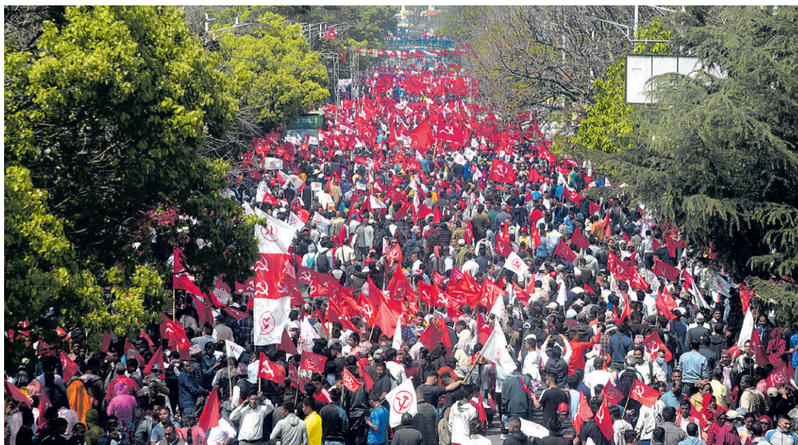
राजधानीको भुक्तुटीमण्डपमा समाजवादी मोर्चाले गरेको प्रदर्शनमा सहभागी हुन आएका नेता तथा कार्यकर्ताहरू।

'घरमा आगो लगाएका छन् मण्डलहरूले, पुलिसमाथि ढुंगा प्रहार गरेका छन्। एकदुई जना मरून् र देशभर आतंक फैलियोस् भन्ने चाहेका छन् त्यो राजावादीहरूको चरित्र हो।' राजावादीहरूको चरित्र सम्पूर्ण जनताले देखेगरी प्रदर्शित भएको प्रचण्डले बताए। एकीकृत समाजवादीका अध्यक्ष माधवकुमार नेपालले गणतन्त्रको पक्षमा भएको परिवर्तन