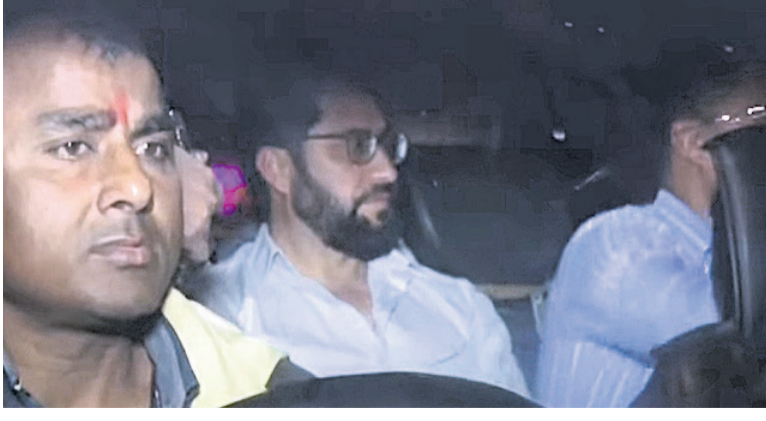
रास्वपाका सभापति रवि लामिछानेलाई शुक्रबार राति उपत्यका अपराध अनुसन्धान कार्यालयको टोलीले पक्राउ गरेर लैजाँदै।