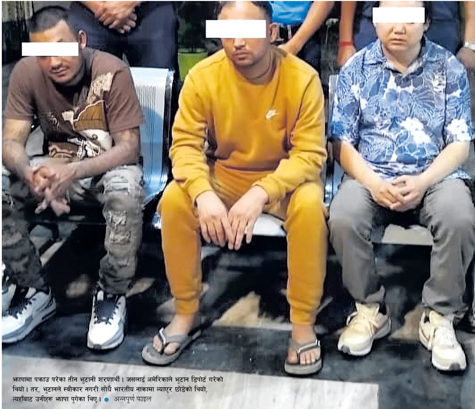
फ्यापामा पक्राउ परेका तीन भुटानी शरणार्थी। जसलाई अमेरिकाले भुटान डिपोर्ट गरेको थियो। तर, भुटानले स्वीकार नगरी सीधै भारतीय नाकामा ल्याएर छोडेको थियो, त्यहाँबाट उनीहरू फ्यापामा पुगेका थिए।