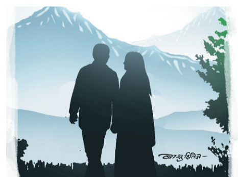
चैलेको आँगनमा पहिलो पाइला - पृष्ठ ४