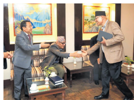
कार्यान्वयन योग्य बजेट ल्याउन सुभाष - पृष्ठ ७