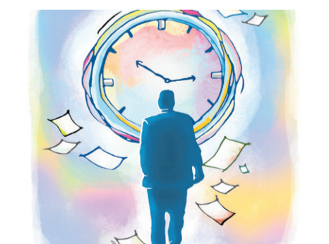
जीवनमा जीवनकै दर्पण - पृष्ठ ५