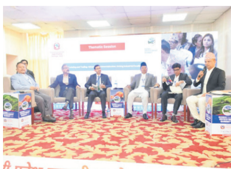
'उद्यमशीलताको वातावरण सरकारले बनाउनुपर्छ' - पृष्ठ ७