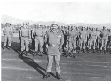
त्यो बक्राङ विद्रोह - पृष्ठ ४