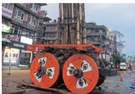
ऐतिहासिक विरासत - पृष्ठ ३