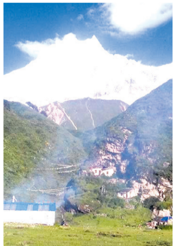
आयोजनाले मनास्लुको फेदी, सामगाउँमा सोही दिनको सम्मनामा हरेक वर्ष मनाउँदै छ।

सोही दिनको सम्मनामा हरेक वर्ष नेपालमा 'मनास्लु डे' मनाउने गरिन्छ। कहिले काठमाडौंमा, कहिले गोरखा सदरमुकाममा, कहिले गाउँपालिकामा र कहिले मनास्लु अवस्थित सामगाउँमा विभिन्न कार्यक्रम गरेर मनाइने गरिन्छ। यसवर्ष मनास्लु संरक्षण क्षेत्र