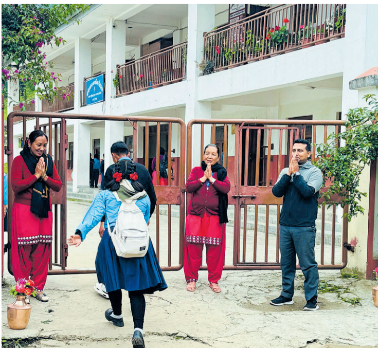
मुस्कानसहित विद्यार्थी स्वागत गर्दै हिमालय माविका शिक्षकहरू।