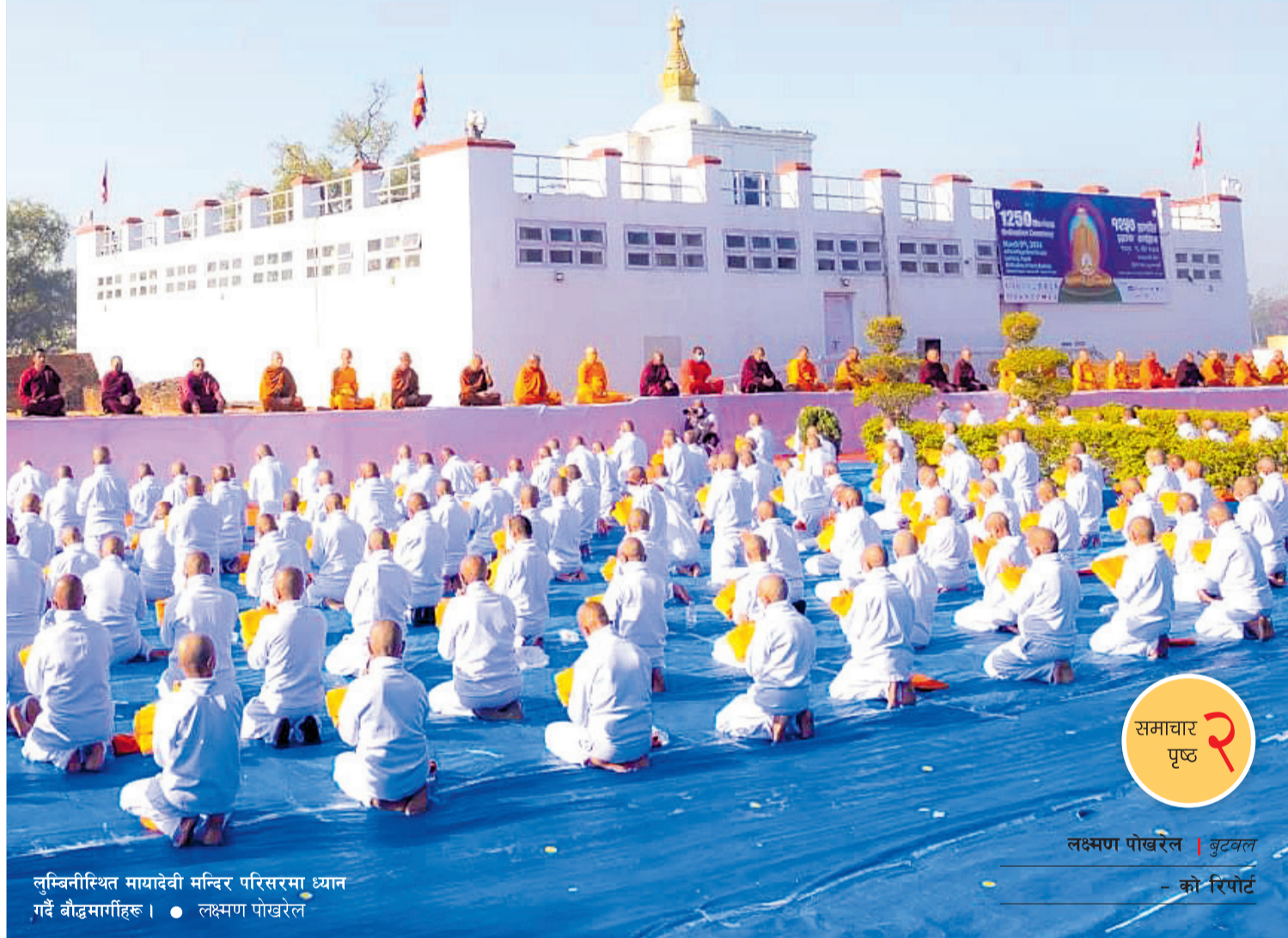
लुम्बिनीस्थित मायादेवी मन्दिर परिसरमा ध्यान गर्दै बौद्धमार्गीहरू।

सर्वोच्च अदालतले लुम्बिनीको पर्यावरण संरक्षणका लागि महत्वपूर्ण आदेश दिएको छ। बुद्ध जन्मस्थलकै अस्तित्व संकटमा परिरहेको भन्दै विश्वव्यापी चिन्ता भइरहेका बेला सर्वोच्चले ऐतिहासिक आदेश दिएको छ। जसअनुसार दुई वर्षभित्र लुम्बिनी आसपासका ६१ उद्योग स्थानान्तरण गर्नुपर्नेछ। भैरहवा लुम्बिनी सडकखण्डमा १९ टनभन्दा बढी क्षमताका मालबाहक गाडी गुडाउन पाइने छैन। उद्योगीहरूले भने यति धेरै उद्योग सार्नुपर्दा ७० अर्ब लगानी र सयौंको रोजगारी जोखिममा पर्ने बताएका छन्।