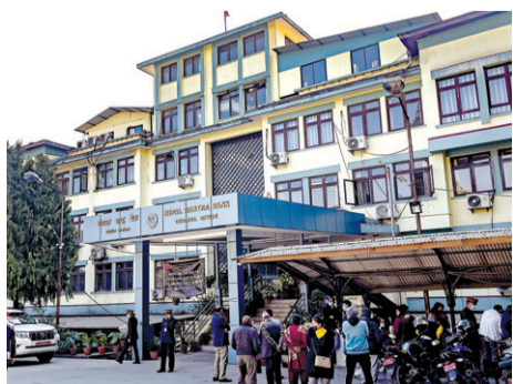
डिजिटल प्रवर्धनमा जोड, घटाइयो डेबिट कार्डको सीमा - पृष्ठ ७