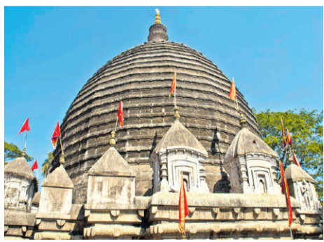
नीलाचलमा १० महाविद्यालयीय कामाख्या - पृष्ठ ५