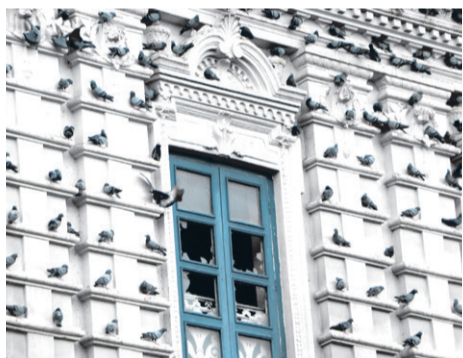
फर्की आऊ शान्ति तिमी ... - पृष्ठ २