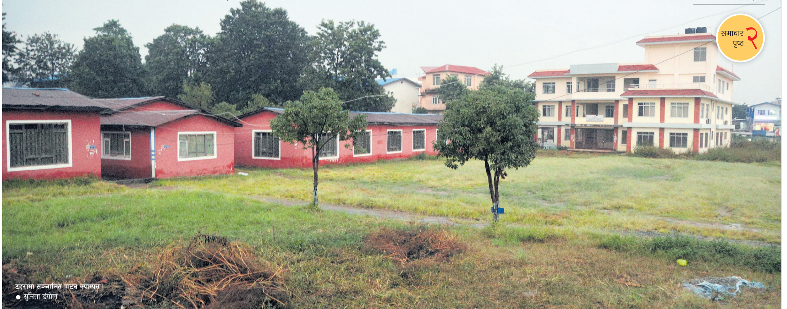
टहरामा सञ्चालित पाटन क्याम्पस।