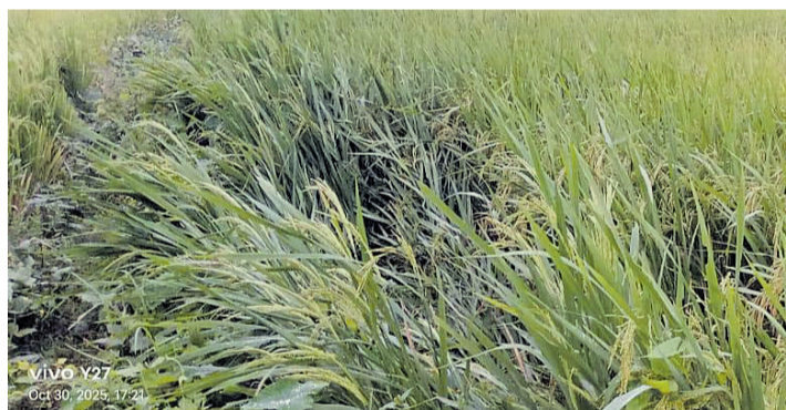
खोटाङको लफ्याङमा पाकेको धान।

कोशी प्रदेशका १४ वटै जिल्लामा बुधबार र बिहीबार परेको वर्षातुलै किसानको खेतमा पाकेको धानमा ठूलो क्षति पुगेको छ। मौसम पूर्वानुमान महाशाखाको अर्भै केही दिन पानी पर्ने जनाएपछि किसान धन थन्क्याउन नपाउने भन्दै पिरलोमा छन्। वर्षाले सुनसरी, मोरङ, भापा, उदयपुर, खोटाङ, भोजपुर, ओखलढुंगा, इलाम, पाँचथरलागायतका जिल्लाका किसान प्रभावित भएका छन्। यी जिल्लामा अहिलेको