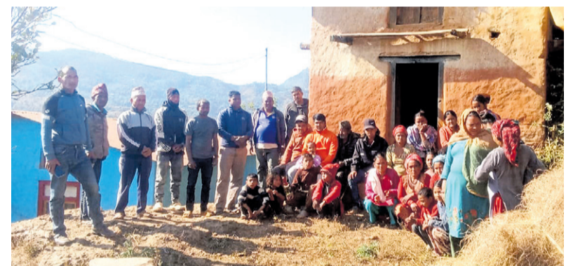
सल्यानको सिद्धकुमाख गाउँपालिकामा रहेको मृतक विकको घर र घरमा भेला भएका आफन्त र छिमेकी। गोपाल शर्मा भट्टराई