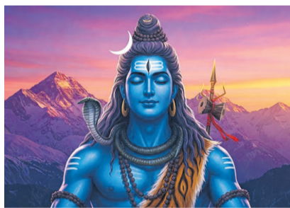
महाशिवरात्रि : साधनाको महापर्व - पृष्ठ ४