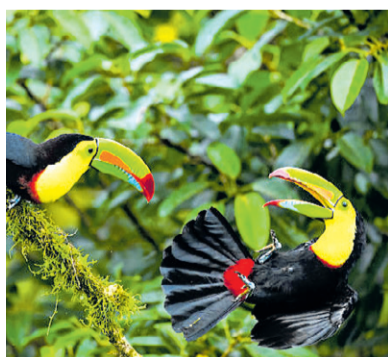
मुन्दुम, मिथक र माटा - पृष्ठ ५