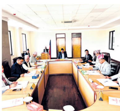
लुम्बिनीमा पनि घटाउँदै मन्त्रालय - पृष्ठ ६