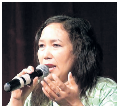
गीत-संगीतको त्यो मन्दिर ! - पृष्ठ ३