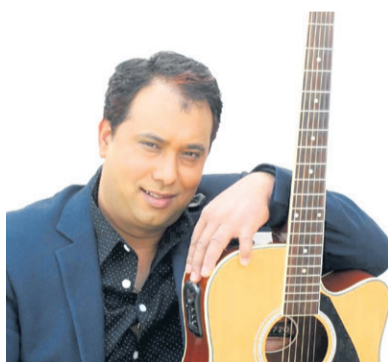
नेपालदेखि अस्ट्रेलियासम्म संगीतको नशा - पृष्ठ ४