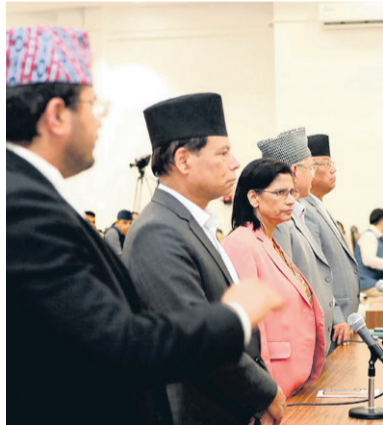
प्रमुख प्रतिपक्ष दल नेपाली कांग्रेसका सभापति गगनकुमार थापाले नेपाल-भारत भूमि समस्याबारे प्रधानमन्त्रीको अभिव्यक्ति निन्दनीय र आपत्तिजनक रहेको बताएका छन्।

प्रधानमन्त्री बालेन्द्र शाहले संसद्मा दिएको सीमासम्बन्धी अभिव्यक्तिलाई लिएर राजनीतिक वृत्त ताँतिएको छ। विपक्षी दलहरूले प्रधानमन्त्रीको उक्त भनाइप्रति कडा आपत्ति जनाउँदै सदनदेखि सडकसम्म आन्दोलन सुरु गरेका छन्। नेपाली कांग्रेस, नेकपा (एमाले), नेपाली कम्युनिस्ट पार्टी, श्रम संस्कृति पार्टी र राष्ट्रिय प्रजातन्त्र पार्टी (राप्रपा) लगायतका दलहरूले छुट्टाछुट्टै विज्ञप्ति जारी गर्दै प्रधानमन्त्रीको अभिव्यक्तिको घोर भत्सा गरेका हुन्। प्रधानमन्त्रीका रूपमा संसद्मा गरेको पहिलो सम्बोधनमा शाह विवादमा तानिएका हुन्। उनले जेठ १७ गते प्रतिनिधिसभामा भनेका थिए, 'तपाईंहरूलाई एउटा कुरा अचम्म लाग्छ होला, मैले पनि अरिष्ट भर्खर प्रधानमन्त्री भइसकेपछि थाहा पाएँ- भारतले नेपालको मात्र होइन, नेपालले पनि भारतको जग्गा धेरै ठाउँमा मिचेको रहेछ।'